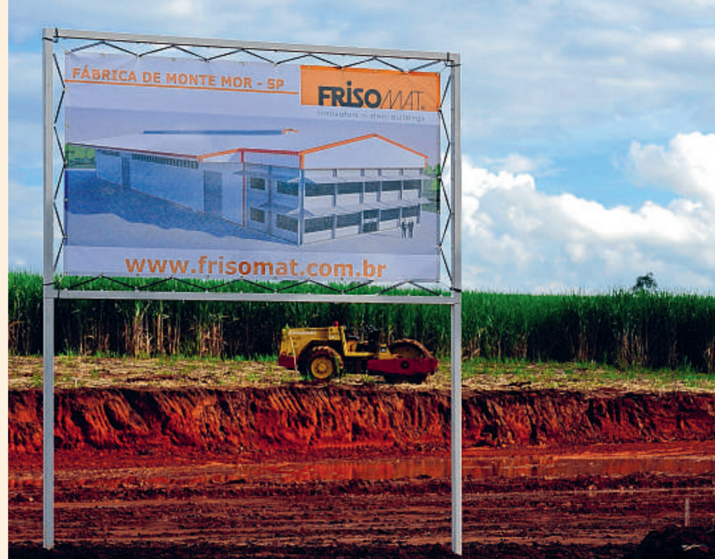
Het 143 hectare groot bedrijventerrein staat nog vol suikerriet, dat nog dit jaar plaats maakt voor de eerste staalverwerkingsfabriek van het Belgische bedrijf.

De Nederlandse elektriciteitsproducent Nuon stopt met de bouw van een centrale voor kolen en biomassa in de Eemshaven in Groningen, in het noorden van Nederland. De bouw van de gasgestookte centrale gaat wel door. Die centrale zal eind 2012 klaar zijn. Dat hebben Nuon en meerdere milieuoorganisaties afgesproken. De